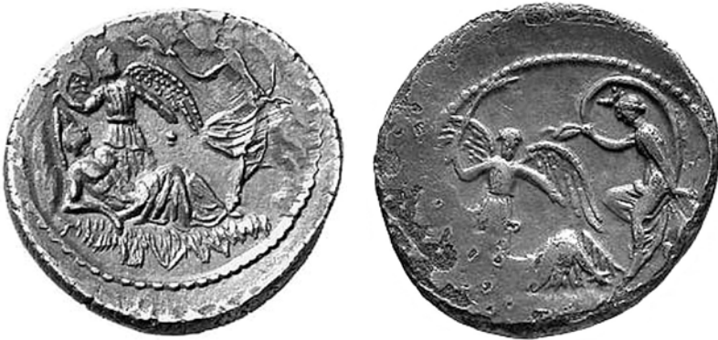
Afb. 3 a, b – Exemplaren van de onmiddellijk na Caesars dood geslagen denarius van Buca.

afgebeeld, aan wie in een droom een krijgsgodin was verschenen die hem een bliksem gaf om zijn vijanden te verslaan. Een nog vreemdere voorstelling van zaken, niet alleen omdat het ondenkbaar is dat een muntmeester van Caesar als Buca, op een van zijn munten Caesars ergste vijand zou hebben afgebeeld, maar ook omdat het muntbeeld geen bliksem laat zien, terwijl de godin de vredelievende Selene is, duidelijk te herkennen aan de maansikkel op haar hoofd. Uiteindelijk, na een eeuwenlang dwaalspoor, heeft dit bizarre denkbeeld moeten wijken voor het inzicht dat hier Endymion en Selene zijn afgebeeld. Maar ook dit voltrekt zich in fasen, want men heeft tot nu toe de gevleugelde gestalte in het midden niet met zekerheid kunnen identificeren. Sommigen zien er Victoria in, anderen Aura, enz. Merkwaardig, want het springt in het oog dat zij met de linkerhand kleine blaasjes op de liggende figuur strooit, wat haar als Aurora kenmerkt, die hem bevochtigt met haar tranen als dauwdruppels, die van de vleugels neervallend hem doen herleven, ja laten opstaan uit de dood. De fakkel in Aurora's rechterhand staat voor een nog nachtelijke scene, maar de godin zelf kondigt het aanbreken van de dag aan.