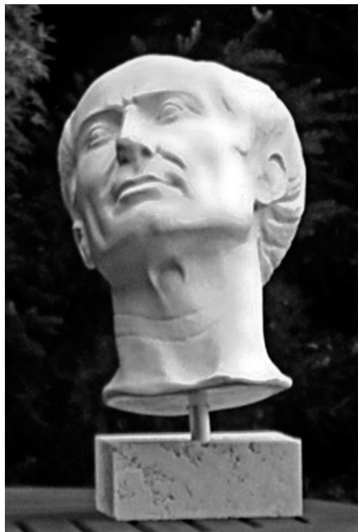
Fig. 2 – Verosimile vista principale del ritratto tuscolano di Cesare, in posizione reclinata.

nel frattempo dimostrato che gli occasionali svenimenti di Cesare non avevano un'origine organica, ma erano dovuti semplicemente a cachessia, esaurimento per la dura vita passata in continue guerre, † e soprattutto perché quella testa marmorea presenta diverse altre anomalie (occhi prominenti e non anatomici, l'orecchio sinistro più alto del destro, ala del naso sinistra appiattita, mandibola sbieca, fossetta della zona tiro-joidica spostata, anelli di Venere verticali, collo torto, spalla destra rialzata, ecc.), deformazioni del tipo di quelle studiate ad arte dagli scultori classici, che fin dal tempo di Fidia le praticavano per rendere più belli i volti delle statue, a seconda di qual era la prospettiva principale, particolarmente per ottimizzarne la vista dal basso. Ed infatti, se si assume per il ritratto tuscolano una postura reclinata del soggetto con vista principale dal basso, tutte le cosiddette anomalie si tramutano in eccellenza estetica (fig. 2). Osservato da questo punto di vista il ritratto tuscolano di Cesare è bellissimo, quasi una Gioconda al maschile.