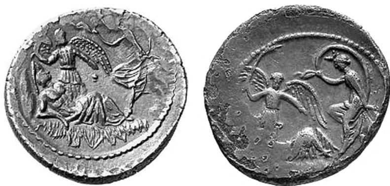
Fig. 3 a, b – Esempari del denario del Buca, coniato subito dopo la morte di Cesare.

E mancavano proprio perché anche ad un altro reperto cesariano, il famoso denario di L. Emilio Buca (fig. 3 a, b), si soleva negarne l'attribuzione a Cesare, vaneggiando che rappresentasse invece Silla, al quale era apparsa in sogno una bellicosa dea che gli dava un fulmine per colpire i suoi nemici. Idea ancor più peregrina, non solo perché è impensabile che da monetale di Cesare il Buca abbia potuto rappresentare su una sua moneta il suo più acerrimo nemico, ma anche perché sull'impronta non c'è fulmine, mentre la dea è la pacifica Selene, chiaramente caratterizzata dalla falce di luna sulla testa. Finalmente, dopo secoli di sviamento, tale bizzarra idea è stata ormai accantonata, a favore di una raffigurazione di Endimione e Selene. Anche qui però a rate, perché non si è saputo finora dare un nome certo alla figura alata centrale, dicendola chi Vittoria, chi Aura, ecc.. Strano, perché è evidente che sta spargendo colla mano sinistra piccole bollicine sul giacente, il che la identifica come Aurora, che lo sta irrorando colle sue lacrime, quale rugiada che scendendo dalle ali lo va risuscitando, mentre la torcia che regge colla destra caratterizza la scena come notturna, ma annuncia già la luce dell'imminente giorno.