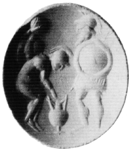
Fig. 10 Gemma italica da Ercolano, tre armati traenti a sorte – variante 7. Museo Archeologico Nazionale, Napoli, inv. 155870. Da PANNUTI 1983, p. 100 ss., nr. 147 e 147a.

Tale interpretazione delle gemme anulari italiche come raffiguranti i triumviri sotto le mitiche spoglie degli Eraclidi, spiegherebbe perché si diano anche delle gemme senza colonna (figg. 10-11) e perfino con solo due personaggi invece di tre (fig. 11) 20 . Esse documente-