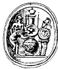
Fig. 4b Idem. Da E. BABELON, La gravure en pierres fines: camées et intailles , Parigi 1894, p. 103, fig. 74.