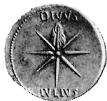
Fig. 5 b Sidus Iulium . BMC Gaul 140, Imp. 328 (RIC 253).