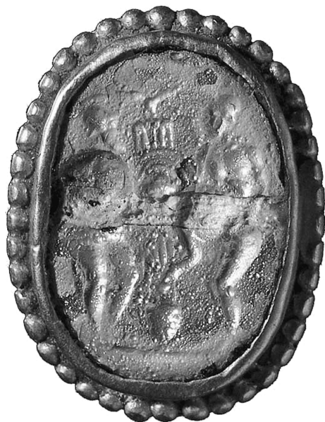
Fig. 8 Placca con gli Eraclidi, tre armati traenti a sorte – variante 6. Reperto da Tullia Tepe, Afganistan, Museo di Kabul. Scavi: Victor Sarianidi, < http://wp.me/PzDfd-3fX >.

che stava sulla colonna degli Eraclidi del cratere di Hamilton e della quale cui era attribuito. Nell'ipotesi che sulle gemme sia raffigurata la colonna eretta sul luogo della cremazione di Cesare, in tale posizione, sopra la colonna di fronte all'osservatore e pronto a spiccare il volo per attaccare (figg. 7-8), l'uccello con le ali spianate potrebbe o rappresentare l'aquila di Giove con cui Cesare in quanto dio venne identificato 16 , o alludere anche alle Eumenidi o Erinni, le furie che chiamano a vendicare l'uccisione, ciò che i triumviri effettivamente fecero prima con le proscrizioni e poi con la sconfitta che inflissero a Bruto e Cassio a Filippi.