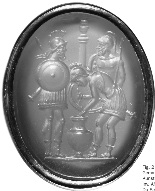
Fig. 2 Gemma italica, tre armati traenti a sorte – variante 1. Kunsthistorisches Museum, Vienna, Inv. ANSA IX b 1299. Da SIMON 2011, p. 176, fig. 8; tav. VII.

La Simon ne deduce conseguentemente che una serie di gemme italiche realizzate tre secoli e mezzo dopo, nel secondo quarto del primo secolo a.C. nel periodo della guerra civile romana, rappresentanti anch'esse tre uomini armati in simile gesto con di fronte un'idria e davanti ad una colonna, e attestanti così un riscontro iconografico (fig. 2), abbia ripreso il sorteggio degli Eraclidi come controesempio mitico per la speranza di pacifica divisione o distribuzione delle terre ai legionari, in contrasto colle drammatiche e dolorose espropriazioni operate in quegli anni dai condottieri romani, come documentato nella prima ecloga di Virgilio 2 .