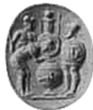
Fig. 4a Gemma italiana, tre armati traenti a sorte - variante 3. Cabinet des Médailles, collection Luynes, Parigi. Da A. FURTWÄNGLER, Die antiken Gemmen. Geschichte der Steinschneidekunst im klassischen Altertum , I, Berlino 1900, tav. XII, nr. 47.