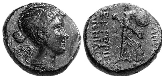
Fig. 9 Moneta di Fulvia della città di Eumeneia. RPC I 3139, Fulvia AE 19. Eumeneia, Frigia, il nome della città essendo stato cambiato in quello di Fulvia. Ca. 41-40 a.C. Recto: busto di Fulvia come Nike alata, rivolta a destra. Verso: dea della città in veste di Atena, in piedi, rivolta a sinistra, portando scudo e lancia; ΦΟΥΛΟΥΙΑΝΩΝ ΖΜΕΡΤΟΡΙΓΟΣ ΦΙΛΩΝΙΔΟΥ «Zmertorix, figlio di Philonides, Magistrato dei Fulviani». Classical Numismatic Group <cngcoins.com>.

Eumenide rimembra Fulvia; la Medusa, come attributo di Atena, indicherebbe entrambi, sia Fulvia, che riprodusse Atena sulle proprie monete, sia Antonio, per la sua relazione particolare con la città di Atene e che consumerà con la dea persino uno hieros gamos 18 , cosicché il guerriero con la Medusa sullo scudo sarebbe in ogni caso Antonio. Quando invece sullo stesso scudo appare in luogo della Gorgone il sidus Iulium ciò connoterebbe il guerriero come Ottaviano, che forse perciò perde la barba; a quest'ultimo potrebbe relazionarsi per un verso anche la eventuale residua sfinge, che egli inizialmente usava come sigillo 19 . Il piccolo scudo tondo, la caetra , potrebbe, come sopra osservato, indicare Lepido.