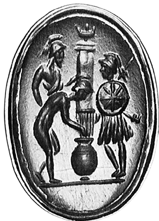
Fig. 3 Gemma italiana, tre armati traenti a sorte - variante 2. Kunsthistorisches Museum, Vienna, Inv. ANSA IX b 671. Da ZWIERLEIN-DIEHL 1973, p. 106, nr. 285, tav. 49.

Ciò identificherebbe la colonna come quella di marmo numidico alta quasi venti piedi con l'iscrizione «Al Padre della Patria», innalzata dal popolo sul bustum Caesaris , il luogo della sua cremazione nel foro, «dove per molto tempo continuò ad offrire sacrifici, a fare voti e a dirimere controversie nel nome di Cesare» 9 . Testimonio e luogo ideale dunque, davanti al quale simbolicamente far avvenire la sortitio provinciarum sanzionante la spartizione del territorio dell'impero fra i triumviri cesariani, gli Eraclidi romani.