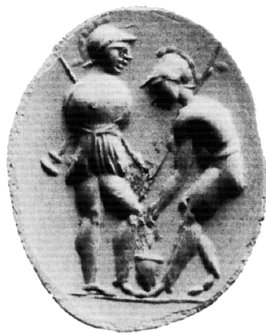
Fig. 11 Gemma italica da Pompei, solo due armati traenti a sorte – variante 8. Museo Archeologico Nazionale, Napoli, inv. 158752. Da PANNUTI 1983, p. 100 ss., nr. 148 e 148a.