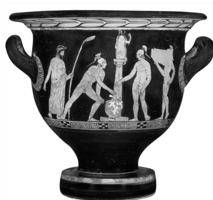
Fig. 1 Tre armati traenti a sorte. Cratere detto di Hamilton, attribuito al Pittore di Nicia, collezione privata. Lato anteriore. Da SIMON 2011, p. 170, fig. 1; tav. I.

Nell'articolo Oxylos und die dritte Generation der Herakliden 1 Erika Simon dimostra oltre ogni dubbio che nella scena dipinta sul cratere attico del 420-410 a.C., detto di Hamilton e attribuito al Pittore di Nicia, i tre giovani nudi e muniti d'elmo raffigurati davanti ad una colonna sormontata da un'Athena e con di fronte un'idria (fig. 1), sono effettivamente gli Eraclidi nell'atto di tirare a sorte la spartizione del Peloponneso, come primitivamente ben visto dall'Hamilton stesso, escludendo così interpretazioni alternative e meno pertinenti che erano andate nel frattempo via via proponendosi.