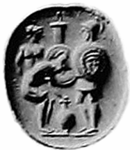
Fig. 7 Gemma italica, tre armati traenti a sorte – variante 5. Parigi. Da BABELON 1899, pp. 42-43, nr. 108; tav. VII. Gallica, Bibliothèque Numérique, < http://gallica.bnf.fr/ark:/12148/bpt6k5774690b >.