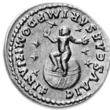
Abb. 12. Aureus des Divus Caesar (82–84 n. Chr.). 155 Legende: DIVVS CAESAR IMP[eratoris] DOMITIANI F[ilius].

Da diese Stelle nicht von einem AT-Zitat überlagert ist, kann man die Bilder deutlicher erkennen: Die sieben Sterne gehen auf Caesars Katasterismus zurück ( supra ), Motiv, das auch später in der Ikonographie der frühgestorbenen Thronfolger, als in den Himmel versetzt und mit den Sternen spielend, zu sehen ist, zum Beispiel für den jung verschiedenen und divinisierten Sohn des Kaisers Domitian, Divus Caesar . 154