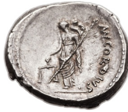
Abb. 23d. Denar des Münzmeisters Mn. Cordius Rufus (46 v. Chr.). 241 Rv: Venus Genetrix mit Waage in der r. Hand, in der l. das Zepter, auf der Schulter Cupido. Legende Rv: MN·CORDIVS (Av: RVFVS·IIIVIR).

soll bereits die Waage in der rechten Hand gehalten haben, wie auf einer Münze mit caesarischem Motiv aus demselben Jahr zu sehen. 240