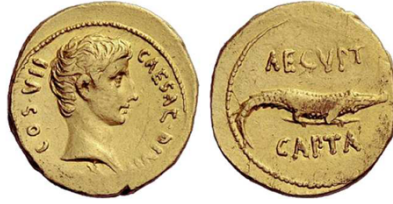
Abb. 5. Aureus des Octavian (noch nicht Augustus), nach 27 v. Chr. 38

Bild Rv: Krokodil (Symbol Ägyptens und der Kleopatra)