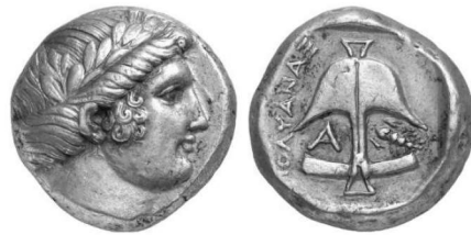
Abb. 13d. AR Tetradrachme aus Apollonia Pontika (ca. 350 v. Chr.). 187

Als solche ergeben die oben abgebildete Denarii durchaus Sinn. Abb. 13a sieht aus wie der Prototyp von Abb. 13. Der auf dem ersten Denarius (Abb. 13a) abgebildete Apollo ist jugendlicher und personalisierter als der abstrakte Gott von den Abb. 13b, und ähnelt jenem auf Münzen aus Apollonia.