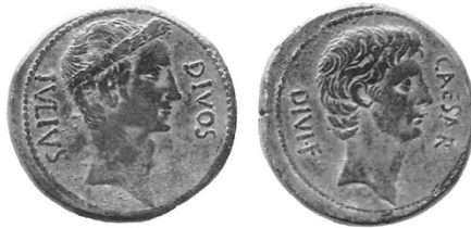
Abb. 14. Denarius des Octavian (42 v. Chr.). 194

Dass dieser Stuhl der Thron des Divus Iulius im Himmel ist, verdeutlichen andere Münze des Octavians aus derselben Zeit, mit Divos Iulius und Caesar Divi filius .