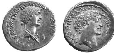
Abb. 4. Denar von Kleopatra und Antonius, 34 v. Chr. 35