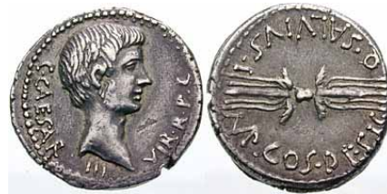
Abb. 16. Denarius des Salvidienus (40 v. Chr.). 200 Av: Kopf Octavians r. mit Flaumbart. Rv: Geflügeltes Blitzbündel mit glandes . Legende: Av: CAESAR·III·VIR·R(ei)·P(ublicae)·C(onstituendae); Rv: Q·SALVIVS·IMP·COS·DESIG.

Dasselbe Blitzbündel befindet sich auch abgebildet auf dem Denar eines Bleischleuderers auf Seiten des Caesar Octavian im perusinischen Krieg.