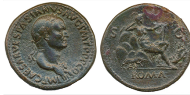
Abb. 1. Sesterz des Vespasian, 69 n. Chr. 12

Legende Av: IMP CAESAR VESPASIANVS AVG P M T P P COS III