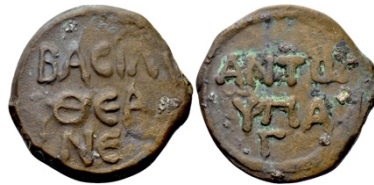
Abb.3. Kupfermünze von Kleopatra und Antonius, Kyrenaika, 31 v. Chr. 30

Rv: ΑΝΤΩΝΙΟΣ ΑΥΤΟΚΡΑΤΩΡ ΤΡΙΤΟΝ ΤΡΙΩΝ ΑΝΔΡΩΝ, «Antonius Imperator zum dritten Mal Triumvir».