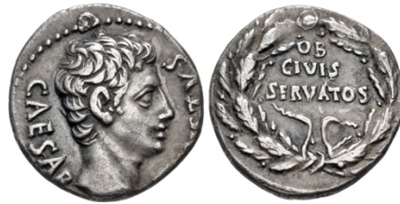
Abb. 11a. Denarius des Augustus (19–18 v. Chr.). 138

besiegte Pompeius. 136 Als Servator wurde auch der neue Caesar, Octavian Augustus, ausgezeichnet: Die corona civica , ob civis servatos , «der Eichenkranz für die Errettung von Bürgern», wurde ihm im Jahr 27 v. Chr. durch Senatsbeschluss zuerkannt. 137