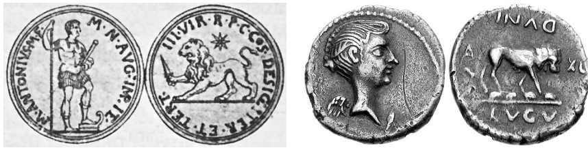
Abb. 20a. Aureus des Antonius (38 v. Chr.). 209

Die zentrale Handlung, der Kniefall der Ältesten, das Anbeten des Herrn, das Werfen ihrer Kronen vor den Stuhl, verdeutlicht, dass es sich um die Konsekration Caesars handelt, als die Senatoren von den Triumviri gezwungen wurden, ihn als Divus Iulius anzuerkennen. Das Verb der Begründung, ὅτι σὺ ἔκτισας τὰ πάντα, «Du hast alle Dinge geschaffen», macht klar, dass es sich um den κτιστής handelt, den Gründer der Kolonien, den creator , den Parens Optime Meritus , der das Reich geboren hatte. Entsprechend beziehen sich die Tiersymbole auf die Triumviri, die Caesars Erhöhung zu den Göttern erwirkt hatten: der Löwe auf Antonius, den er auf seine Münzen prägte, wie es auch Fulvia tat, seine Frau. Der Stier als signum der Legionen Caesars, zu sehen auf dessen Münzen und auch jenen seines Adoptivsohns, passte in der Form μύσχος, «Sprössling», auch der Menschen, bestens zu dem jungen neuen Caesar, Octavian, der puer genannt wurde, und daher, wenn Rind, dann Kalb, junger Stier. Auf den Münzen des Lepidus sind keine Tiersymbole zu sehen, so ist er ein Kandidat für das menschliche Antlitz. Das vierte Tiersymbol, den Adler, seit Caesars Onkel Marius signum aller römischen Legionen, findet man auch auf Münzen des Adoptivsohns, Caesar Octavian.