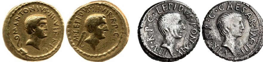
Abb. 22a. Aureus des Triumvirats, Antonius mit Lepidus (43 v. Chr.). 213 Abb. 22b. Denarius des Triumvirats, Lepidus mit Octavian (42 v. Chr.). 214