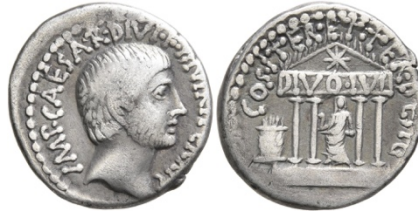
Abb. 19. Denarius des Octavian (36 v. Chr.). 205 Av: Kopf Octavians r. mit Flaumbart und längerem Haar am Hinterkopf, als Zeichen der Trauer. Rv: Tempel des Divus Iulius mit Caesars Stern auf dem Giebel, DIVO IVL(io) auf dem Architrav, darin Statue Caesars, den Lituus haltend, links brennender Altar. Legende: Av: IMP·CAESAR·DIVI·F·III·VIR·ITER·R·P·C. Rv: COS·ITER·ET·TER·DESIG.

In der damaligen Ikonographie wurden Kometen als Sterne mit einer Flamme wie Fackeln dargestellt – siehe Münzen Abb. 18 sowie Wortwahl bei Ovid, ignescere, flammiferum ( supra , Anm. 164) –, so passte das Bild; und da das sidus Iulium sieben Nächte lang erschienen war, 206 konnte der Apokalyptiker von sieben Fackeln reden, und machte zahlenmässig entsprechend auch die vom Volk im Kometen erkannte Seele des unsterblich gewordenen Caesar zu den sieben Geistern Gottes.