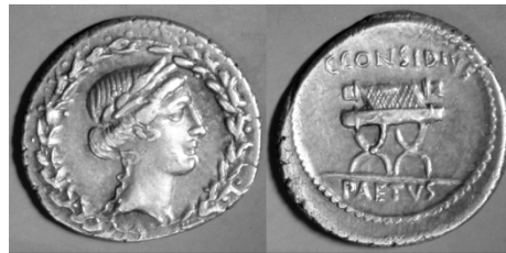
Abb. 13b3. Denarius des C. Considius Paetus (44 v. Chr.). 181 Av: Lorbeerbekrönter Kopf des Apollo, r., innerhalb eines Lorbeerkranzes. Rv: Girlandierte Sella curulis , ohne Kranz um den libellus . Legende Av: keine; Rv: C-CONSIDIVS-PAETVS.

Der Münzmeister Considius Paetus, von dem sonst nichts bekannt ist, 182 wird jedoch identifiziert mit jenem C. Considius, Sohn des C. Considius Longus, 183 wie sein Vater Pompeianer und Gegner Caesars in Africa, den aber Caesar 46 begnadigte. 184 Da seine Typen fast immer ein cäsarisches Motiv haben, insbesondere Venus Victrix, auch mit Cupido auf der