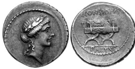
Abb. 13b2. Denarius des C. Considius Paetus (44 v. Chr.). 180 Av: Lorbeerbekrönter Kopf des Apollo, r., im grènetis, nicht innerhalb eines Kranzes. Rv: Girlandierte Sella curulis , mit Kranz um den libellus . Legende Av: keine; Rv: C-CONSIDIVS-PAETVS.