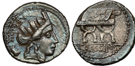
Denar des P. Furius Crassipes

Crawford, RRC 356 Taf. 47,2, Th. SCHÄFER loc. cit. S. 84.