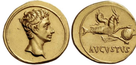
Abb. 6. Aureus des Octavian (bereits Augustus), 18–16 v. Chr. 39