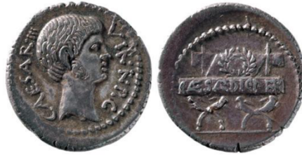
Abb. 13. Denarius des Octavian (42 v. Chr.). 170