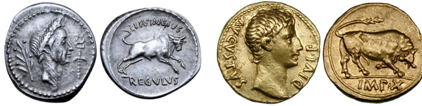
Abb. 21a. Denar Caesars (42 v. Chr.). 211 Abb. 21b. Aureus des Augustus (15–12 v. Chr.). 212