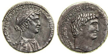
Abb.2. Tetradrachme von Kleopatra und Antonius, 36–33 v. Chr. 29

– kommt man auf 665. Womit alle drei Varianten der Zahl erklärbar werden.