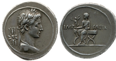
Abb. 17. Denarius des Octavian (29–27 v. Chr.). 202

Als Herme mit Blitzbündel, als Imperator Caesar auf der sella curulis sitzend und der Victoria auf der rechten Hand, vervollständigte dann Caesar Octavian die angestrebte Identifizierung mit Divus Iulius als ein neuer Jupiter: wie der Vater im Himmel so der Sohn auf Erden.