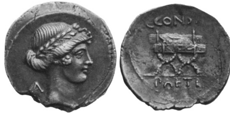
Abb. 13a. Denarius des C. Considius Paetus (44 v. Chr.). 178

C. Considius Paetus –, auch welcher Gott auf dem Avers steht – Apollo –, aber nicht wo wann wofür und für wen sie geprägt wurden.