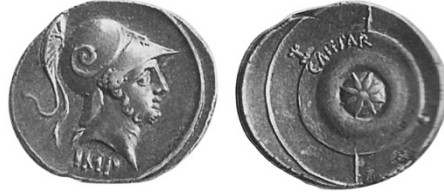
Abb. 24. Denar des jungen neuen Caesar (42 v. Chr.). 272

Heeres. Es wird als signum für die caesarischen Legionen gedient haben, um sie auf den Kriegsdienst einzuschwören, gerade im Bürgerkrieg fundamental. 270 Tatsächlich befindet sich das sidus Iulium mittig auf dem Schild des jungen Mars auf einer nach der Schlacht bei Philippi geprägten Münze, die den siegreichen Octavian als akklamierten Imperator Caesar preist. 271