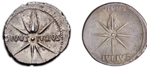
Abb. 18. Denarii des Augustus (19–18 v. Chr.). 204 Rv: Caesars Komet, stella crinita , sidus Iulium . Legende: DIVVS IVLIVS.