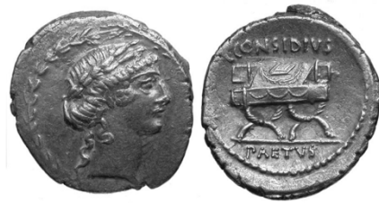
Abb. 13b1. Denarius des C. Considius Paetus (44 v. Chr.). 179

Av: Lorbeerbekränzter Kopf des Apollo, r., innerhalb eines Lorbeerkranzes.