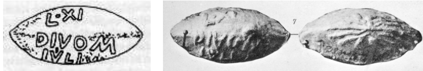
Abb. 15a, 15b. Bleierne glandes aus dem Schlachtfeld des bellum Perusinum . 199 Blitzbündel. Legende: L·XI DIVOM IVLI(um).

Das «Ausgehen» war wohl sehr heftig gemeint, wie für Blitze üblich, denn Octavian ließ während des bellum Perusinum tatsächlich bleierne Projektile, die berühmten perusinae glandes , gegen die Armee der Fulvia und des Lucius Antonius schleudern, mit Abbildung eines Blitzbündels und der Inschrift Divom Iulium . 198