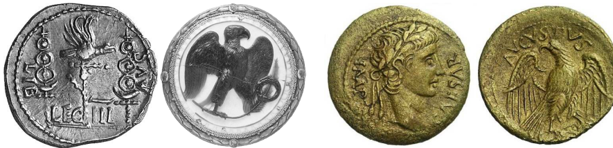
Abb. 23a. Legions Adler. 215 Abb. 23b. Adlercameo des Augustus. 216 Abb. 23c. Quadrans des Augustus (15–10 v. Chr.). 217

Alle vier Tiere sind mitten am Stuhl und um den Stuhl, außenherum und inwendig, das heißt im Zentrum der Macht, in Rom und im Reich, urbi et orbi , am Forum und in der Armee. Und sie sind voller Augen, vorn und hinten, γέμοντα οφθαλμών ἐμπροσθεν και ὀπισθεν (4:6), denn sie sehen alles