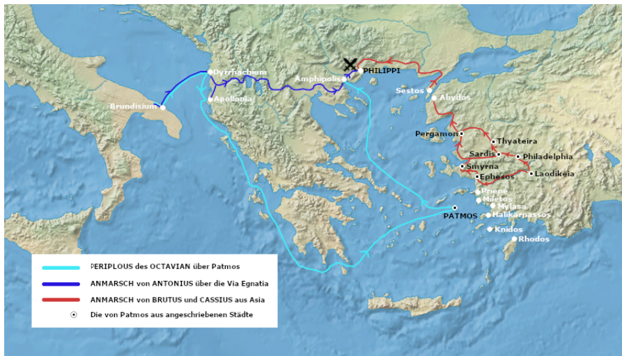
Abb. 11b Karte. Truppenbewegungen vor der Schlacht bei Philippi.

Dort traf Octavian erst zehn Tage nach dem Heer der Caesarmörder ein, und erst recht später als Antonius, denn er war infolge einer Erkrankung in Dyrrhachium zurückgeblieben, von wo er sich aber, als er von den Schwierigkeiten des Antonius erfuhr, dann doch in Bewegung setzte, obwohl er noch nicht geheilt war, und auch nach dem Eintreffen noch nicht kampffähig, sodass er sich in einer Sänfte an den Reihen seiner Soldaten entlang tragen lassen musste. Seine Krankheit spielte übrigens eine Rolle, sowohl bei seiner Niederlage in der ersten Teilschlacht als auch für seine Rettung, denn er hatte deswegen sein Zelt verlassen. 62